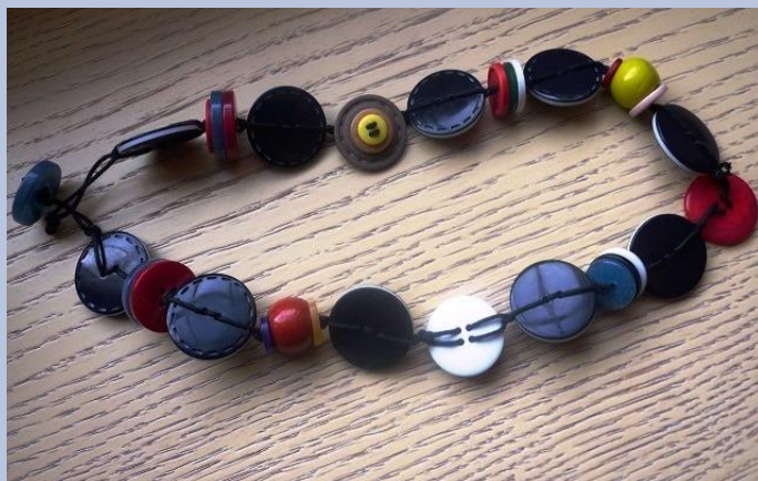
Ecco un altro esempio di collana realizzata con bottoni e pezzi di bachelite.