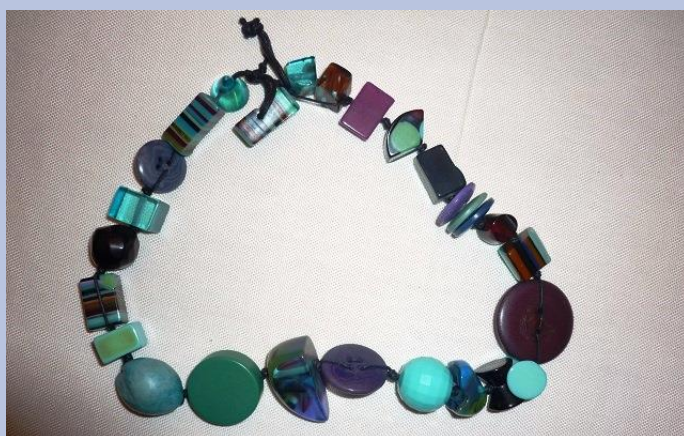
Buon lavoro a tutte, grandi e piccine!